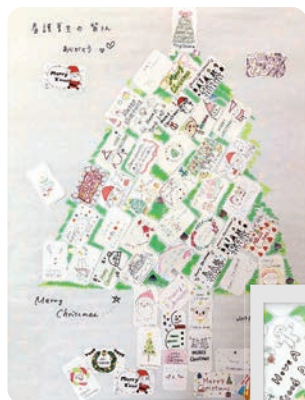
学生の作った クリスマスカードで、 壁にツリーができました。