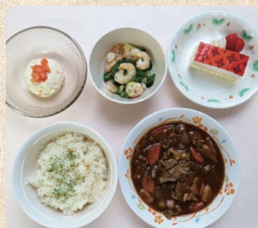
一般食(固形の料理)