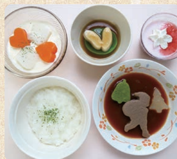
嚥下食(ゼリー状の料理)

12月25日クリスマスの行事に合わせてクリスマスメニューを提供しました。コクのあるビーフシチューにエビをたっぷり使ったソテー、バターライスで洋風に仕上げました。デザートには、一般食はイチゴのケーキ、嚥下食では調理師手作りのイチゴとチョコの2層のババロアをご用意しました。特に嚥下食ではサンタさん型や彩りでクリスマスを感じて頂けるよう工夫しました。