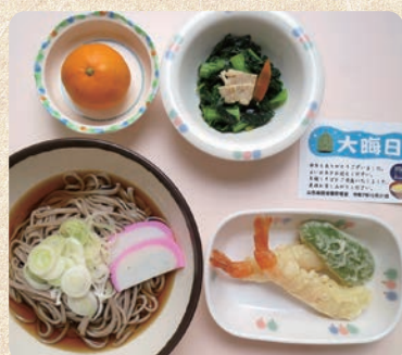
年越しそば 一般食