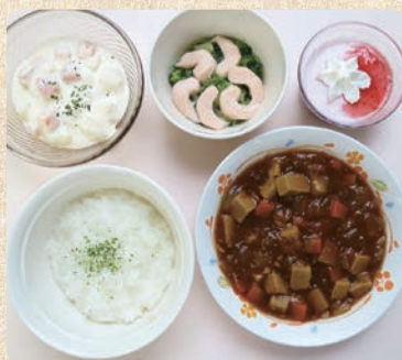
移行食(1cm角軟らか料理)